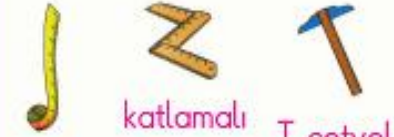
mezura katlamalı cetvel T cetvel