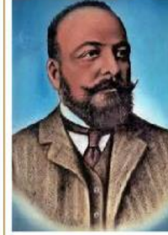
Mehmet Emin Yurdakul

Mustafa Kemal onunla ilgili olarak "Ben inkılap ruhunu ondan aldım." demiştir. Batılılaşma ve çağdaşlaşma konularında, Mustafa Kemal'i etkilemiştir.