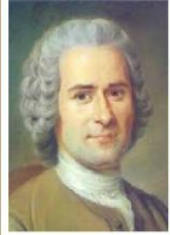
Jean Jacques Rousseau

"Ordunun Destanı" adlı şiirinde Mustafa Kemal'e de yer veren Yurdakul, Mustafa Kemal'de vatan, millet ve millî birlik gibi duyguların yerleşmesinde önemli rol oynamıştır.