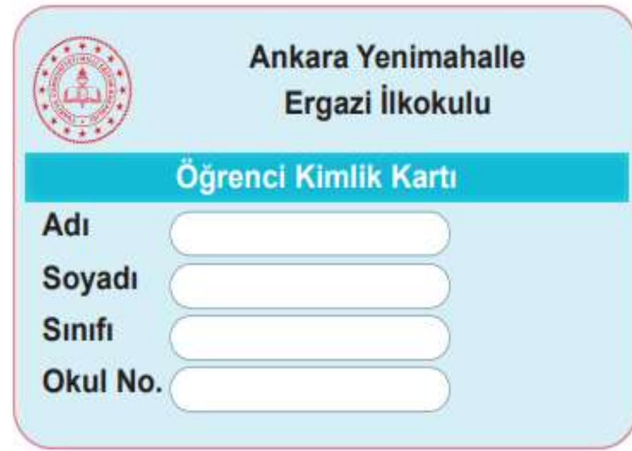
Görsel 1.5 Okul kimlik kartı

Üye tanıtım kartları da kimlik belgemize oldukça benzemektedir. Üye tanıtım kartı, bir kuruluşa üye olduğumuzu gösterir. Bu kartta kuruluşun ismi, adımız, soyadımız, üyelik numaramız, iletişim bilgilerimiz gibi bilgiler bulunur (Görsel 1.6). Üyesi olduğumuz kuruluşla ilgili etkinliklere katılırken bu belgeyi gösterebiliriz.