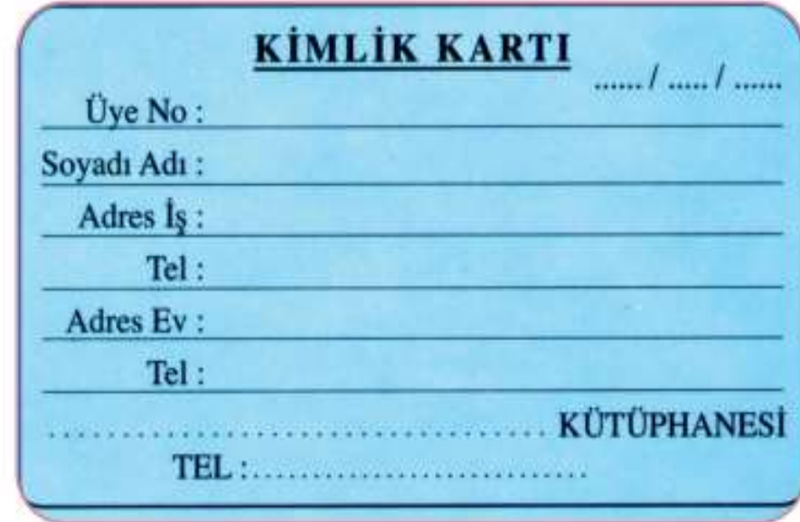
Görsel 1.6 Kütüphane üye kartı